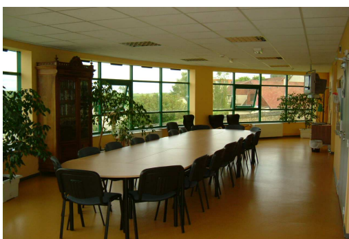
La salle de réunion