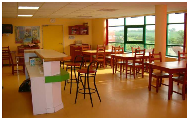
La salle à manger et la cafétéria