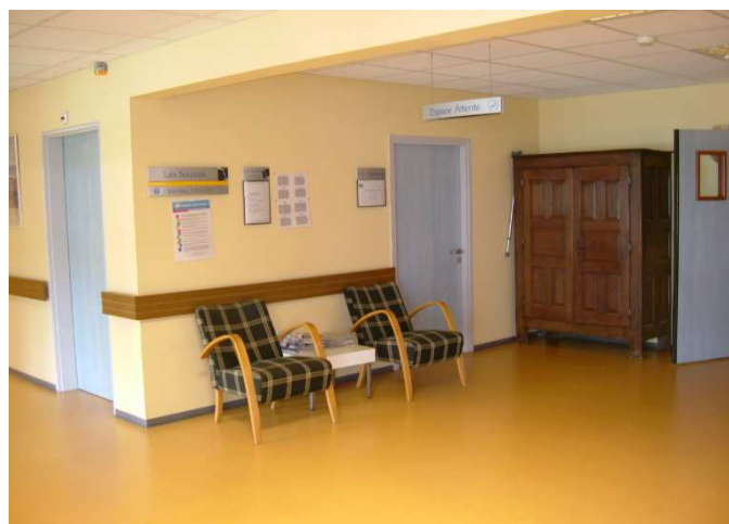
L'entrée du service