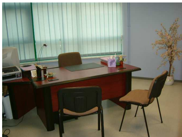
Le bureau de la psychologue