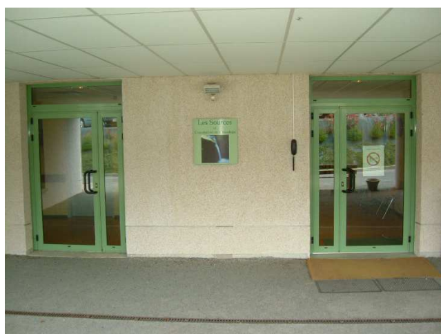
Le hall d'accueil