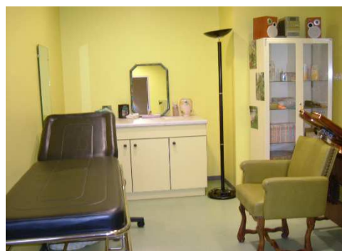
Le salon esthétique